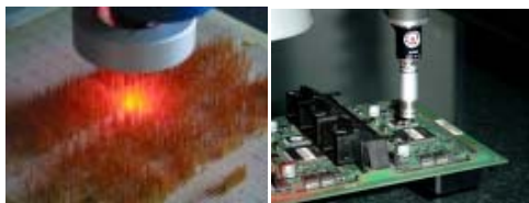
Berührungsloses und taktiles Messen